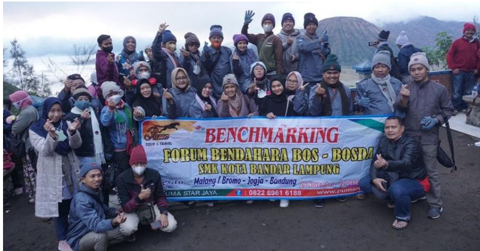
FORUM BENDAHARA BOS SMK