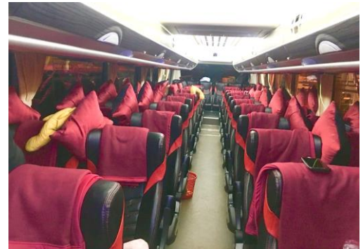
BANTAL + SELIMUT