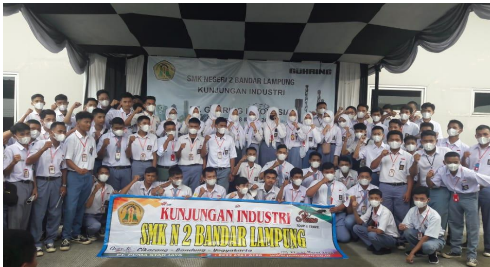
KUNJUNGAN INDUSTRI SMK N 2 BANDAR LAMPUNG 2022