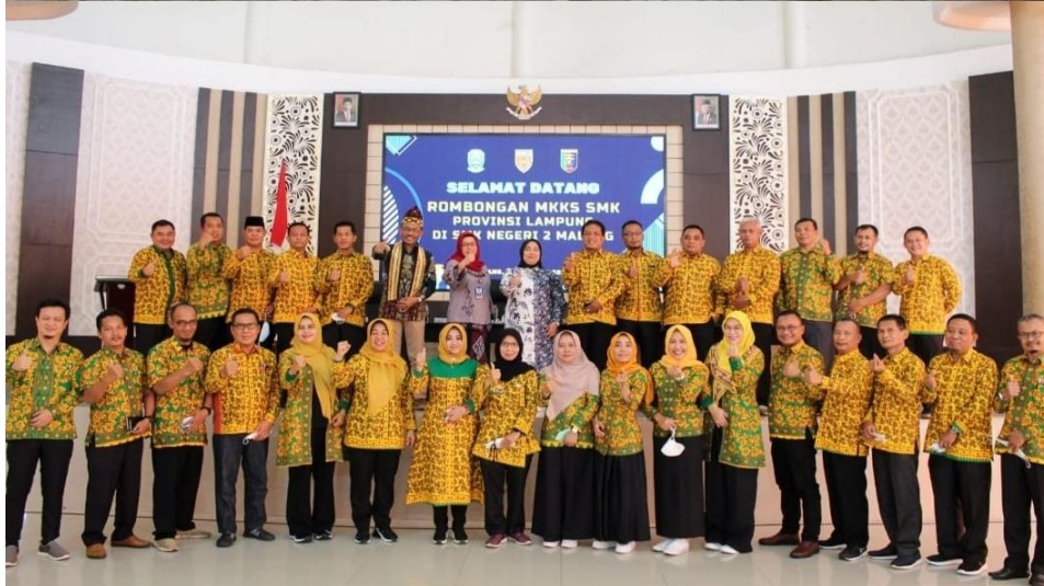
MKKS SMK PROVINSI LAMPUNG 2021