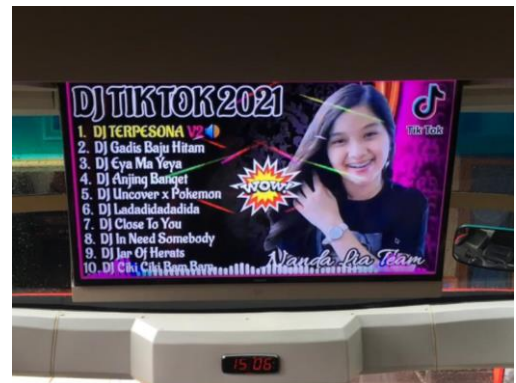
HDMI YOUTUBE CHANEL