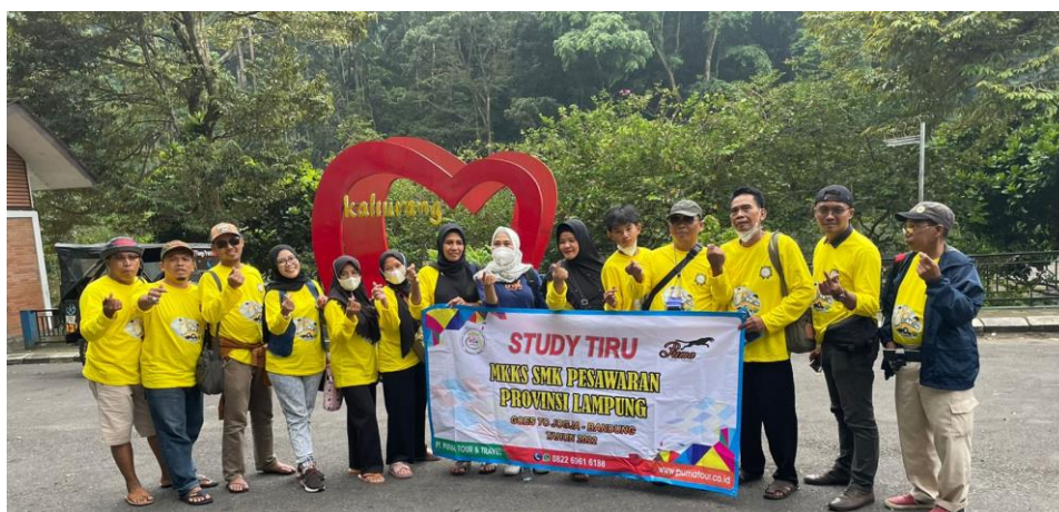
MKKS SMK KAB. PESAWARAN 2022