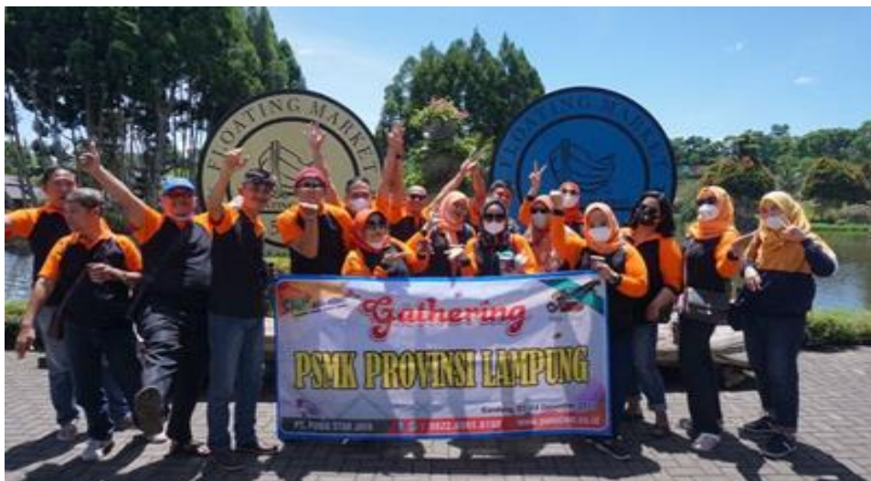
P-SMK PROVINSI LAMPUNG 2021